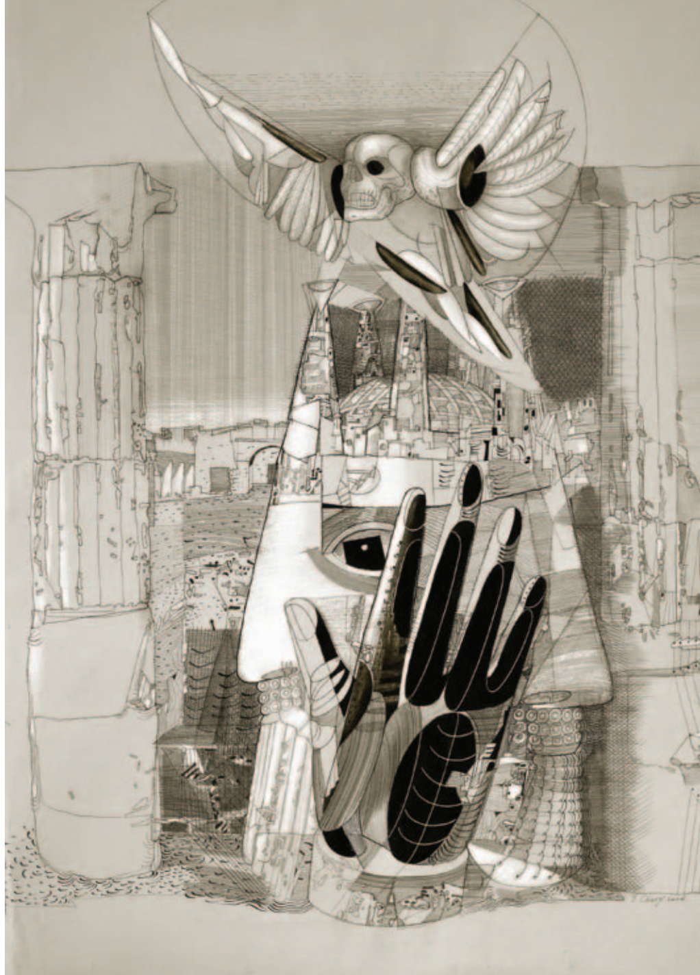
Ю. Чарышников. Иллюстрация из Книги Царств Библии

Они так же обедают за общим столом и так же говорят о книгах, об интересных и редких проектах, об уди-