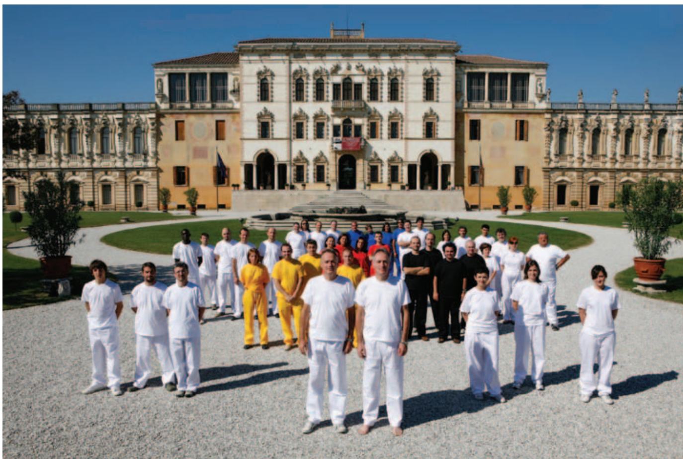
Команда типографии братьев Франк на фоне виллы Контарини, постройки Андреа Палладио

Поразмыслив над всем этим, приходишь к выводу, что это Библия XIX века, и иначе её издать было бы просто невозможно.