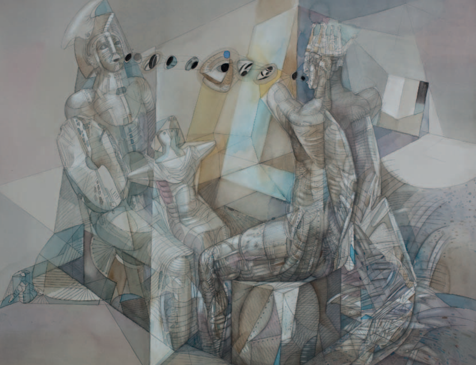
Ю. Чарышников. Иллюстрация из Книги Царств Библии