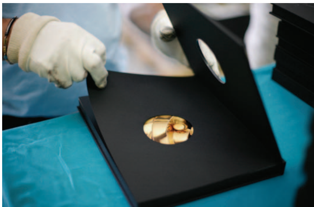
Изготовление деревянного футляра. Ручная работа