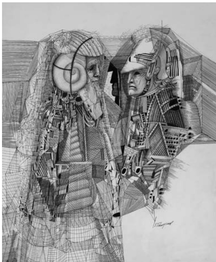
Ю. Чарышников. Иллюстрация из Книги Царств Библии

С этой темой он работал многие годы. Только так художник мог освоить собственный опыт, принять свою судьбу. Ничего удивительного — Библия каждому человеку даёт этот шанс.